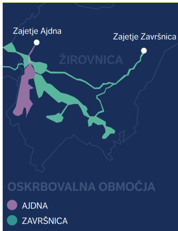
Slika 2: Oskrbovalna območja javnih vodovodov v občini Žirovnica

JEKO, javno komunalno podjetje, d.o.o., Jesenice na območju občine Žirovnica v vseh naseljih izvaja javno gospodarsko službo oskrbe s pitno vodo in naselja v občini oskrbuje z vodo iz 2 (dveh) vodovodnih sistemov - Završnica in Ajdna .