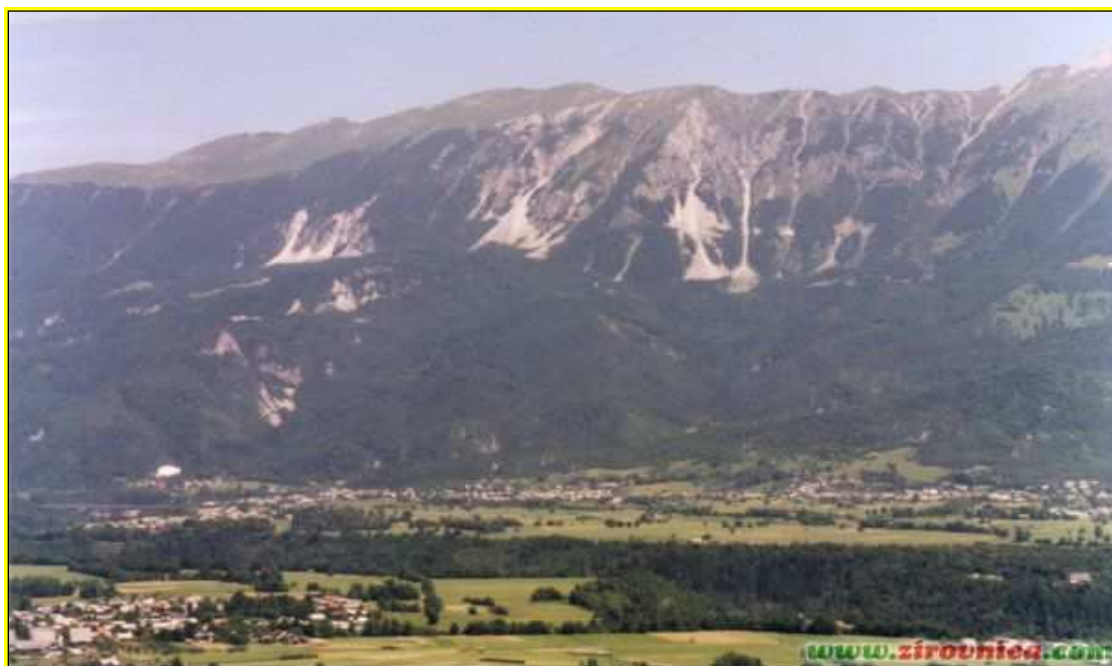
Slika 1: Občina Žirovnica

Občina Žirovnica, je samostojna občina od leta 1998. Območje občine meri 42,6 kvadratnih kilometrov in je sestavljeno iz dveh različnih pokrajinskih enot. Južni del je ravninski, severni pa sega v hribovito področje Peči in nato naprej v gorato območje Karavank. Občina na severu meji z Avstrijo, na vzhodu z občinama Tržič in Radovljica ter na zahodu z občinama Jesenice in Gorje. Tvori jo deset naselij, znanih kot »Vasi pod Stolom«.